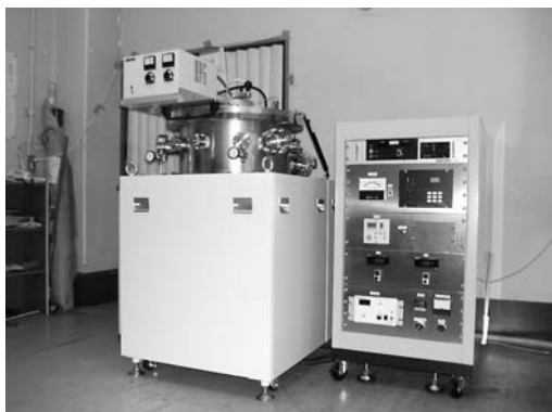
スパッタリング装置