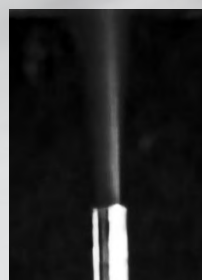
アルミナ(0.1 \mu m) 約4g/min

サブミクロン～100 \mu m程度の微粒子を安定供給可能なテーブル式パウダーフィーダーです。配管を通してキャリアガスと共に微粉末を搬送します。今まで困難であった凝集性の高い、1～数 \mu mの微粒子も送ることができます。