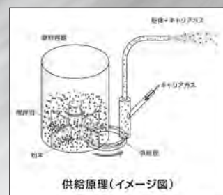
供給原理(イメージ図)