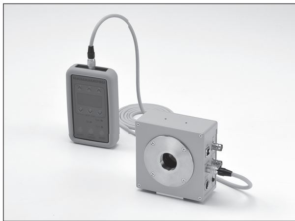
▲左: リモートコントローラ、右: 本体